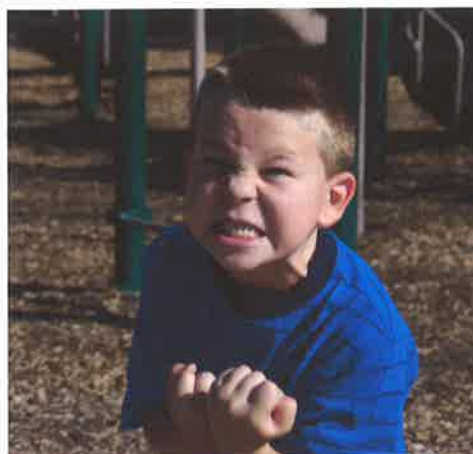
III. 4.6.1 Er aggression noget, vi lærer?

Albert Bandura er kendt for sin forskning inden for social indlæring, der tyder på, at vi ved at observere rollemodeller lærer og efterligner aggressiv adfærd. I det følgende skal vi se nærmere på Banduras kendte Bobo-dukke undersøgelse, som har betydet meget for vores forståelse af, hvordan børn tillærer visse uhensigtsmæssige adfærdsformer.