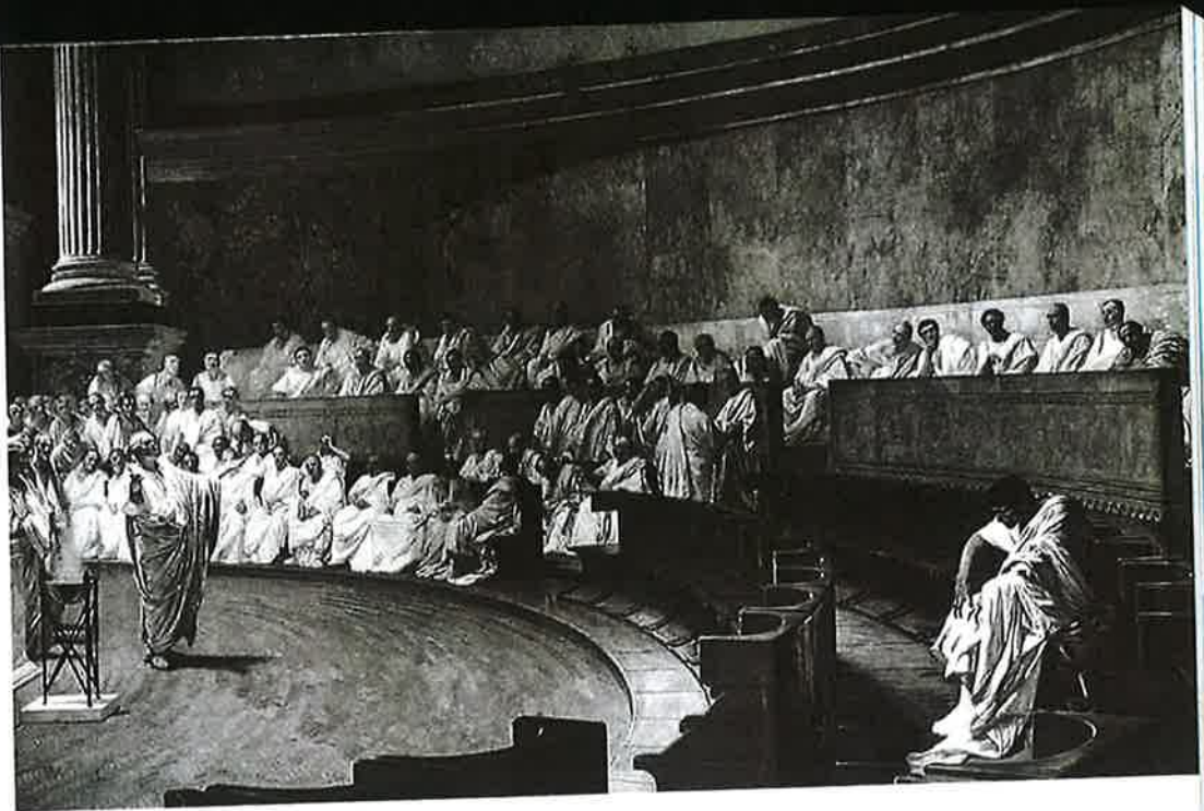
Cesare Maccari: Cicero og Catilina , 1882-88 (Palazzo Madama, Rom). Maleriet forestiller den romerske politiker og advokat Cicero, der som konsul fører en retssag i år 63 f.Kr. mod den oprørske politiker Catalina (først til højre). Catalina havde etableret en sammensværgelse mod den romerske republik, hvilket Cicero opdagede, og derfor fremførte han en anklagesag mod Catalina over for senatet. Det foregik i senatet – i Curia, som i dag er den bedst bevarede bygning på Forum Romanum i Rom.

Endelig må du også forholde dig til, om dit oplæg fx skal holdes sidst en fredag eftermiddag, hvor tilhørerne kun har ganske lidt koncentration og energi tilbage. Dine klassekammerater burde lytte lige opmærksomt af den grund. Men virkeligheden er nok snarere den, at nogle tænker på weekend, mens andre fx er ved at være trætte. Hvordan vil du få dem til at lytte? Du må i hvert fald gøre noget for at få deres tanker væk fra den kommende weekend og for at få dem til at glemme deres træthed. Humor og et par overraskende vinkler på emnet kan være svaret på disse udfordringer.