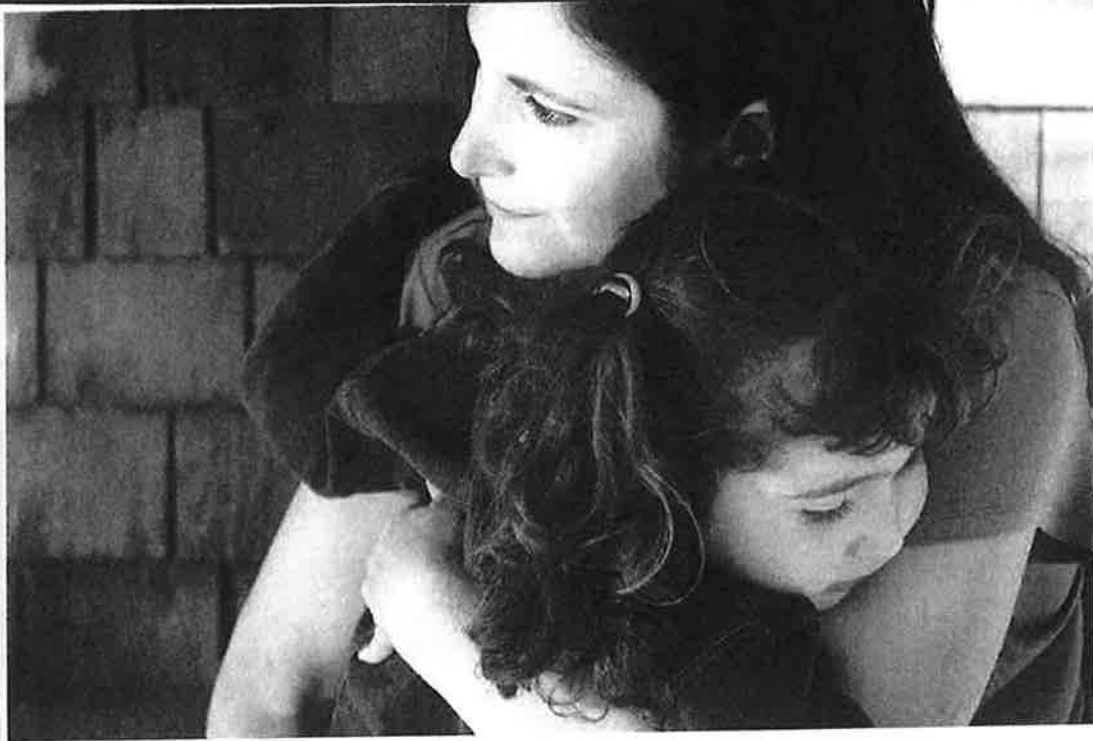
III. 3.3 Tilknytningsadfærd.

kamp mellem to modsatrettede kræfter: På den ene side står barnets behov for at finde tryghed og sikkerhed i den tætte symbiose (forening) med omsorgspersonerne, på den anden side står barnets behov for selvstændighed og uafhængighed . Hos John Bowlby skelnes der mellem barnets tilknytningsadfærd , der får barnet til at opsøge forældrene, når det følger sig utrygt, og udforskningsadfærden , der får barnet til at undersøge sin omverden, når det føler sig trygt.