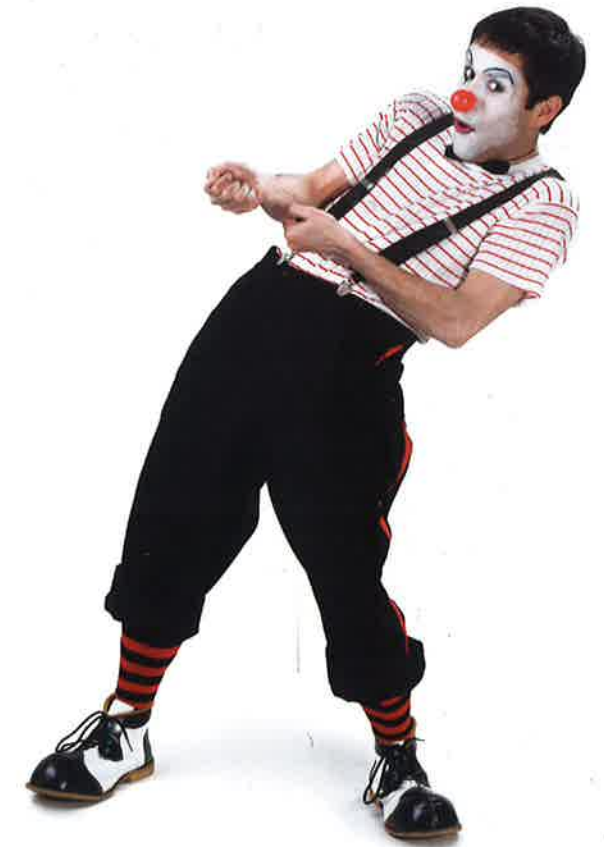
Ill. 18.4 I pantomimen er det helt afgørende at kunne beherske de non-verbale koder.

Koder for øjenkontakt giver regler for hvornår, hvor lang tid og hvor ofte man ser den anden i øjnene under en samtale. Den form for øjenkontakt, der etableres under en samtale, fortæller lige som posituren ofte noget om relationen mellem de to parter. Stirrer vi den anden "ud", fortæller det som regel noget om, at vi ønsker at dominere samtalen. Ser vi ned, mens den anden taler, kan det være et udtryk for underlegenhed eller usikkerhed. Ser vi væk, kan det måske være et tegn på, at vi slet ikke ønsker kontakt med den anden. Øjenkontakt i starten af et udsagn kan opfordre den anden til at være opmærksom eller være et ønske om, at den anden skal acceptere udsagnet uden at stille spørgsmål ved det. Her kan der altså også