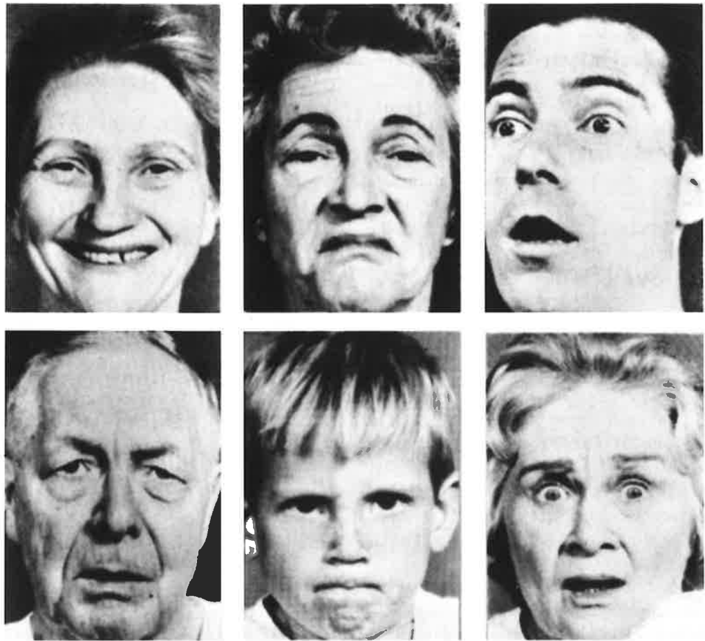
Ill. 18.2 Ansigtsudtryk.

det sagte og gør ofte, det vi siger, mere ram- mende eller udtrykfuldt.