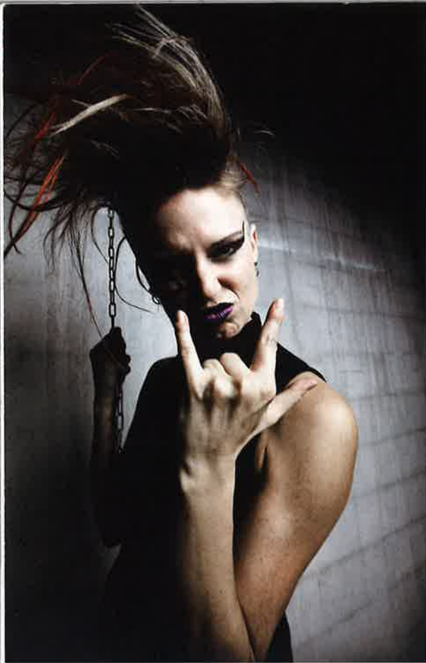
Ill. 18.5 Punk pige fortæller med sin fremtræden og sin gestik.

desuden meget let høre, om vedkommende er usikker, glad, rasende, engageret m.v. Under de ekstra-verbale koder finder vi også ting som accent og dialekt, der kan fortælle noget om, hvor et menneske kommer fra og noget om hans eller hendes sociale baggrund.