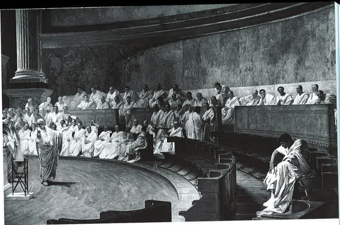
Cesare Maccari: Cicero og Catilina , 1882-88 (Palazzo Madama, Rom). Maleriet forestiller den romerske politiker og advokat Cicero, der som konsul fører en retssag i år 63 f.Kr. mod den oprørske politiker Catalina (forrest til højre). Catalina havde etableret en sammensværgelse mod den romerske republik, hvilket Cicero opdagede, og derfor fremførte han en anklagesag mod Catalina over for senatet. Det foregik i senatet – i Curia, som i dag er den bedst bevarede bygning på Forum Romanum i Rom.

Endelig må du også forholde dig til, om dit oplæg fx skal holdes sidst en fredag eftermiddag, hvor tilhørerne kun har ganske lidt koncentration og energi tilbage. Dine klassekammerater burde lytte lige opmærksomt af den grund. Men virkeligheden er nok snarere den, at nogle tænker på weekend, mens andre fx er ved at være trætte. Hvordan vil du få dem til at lytte? Du må i hvert fald gøre noget for at få deres tanker væk fra den kommende weekend og for at få dem til at glemme deres træthed. Humor og et par overraskende vinkler på emnet kan være svaret på disse udfordringer.