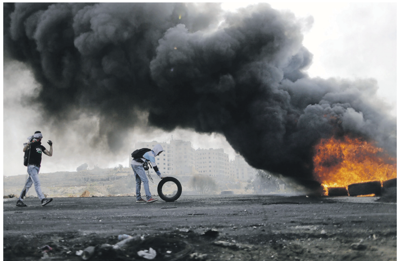
▲ Palæstinensiske teenagere med et bildæk, som de vil brænde af i forbindelse med palæstinensiske sammenstød med israelske soldater ved den jødiske bosættelse Bet El nær Ramallah på Vestbredden.

For at forstå den israelske position må man også se hi-