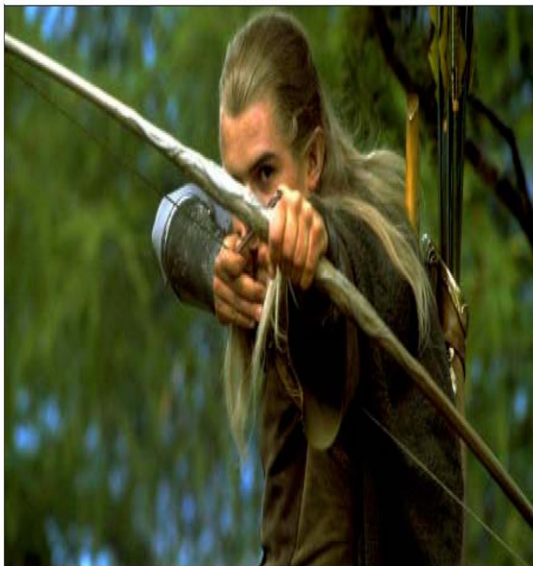
PLETSKUD. Fortællingen 'Ringenes Herre' er blevet filmatiseret, og filmen var et pletskud for både elskere af Tolkiens fortællinger og for de mennesker, der har puttet penge i filmprojektet.

Selv om de fantastiske fortællinger er meget populære lige nu, har genren eksisteret længe. I 1800-tallet udkom E.T.A. Hoffmanns 'Det